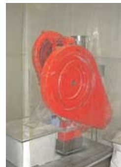
Die beiden Maschinen dienen der hauseigenen Herstellung der Schüssler-Salze.

Wetten, dass die Wettstein-Apotheke auch zu Ihrer Apotheke des Vertrauens wird, wenn sie es nicht schon längst ist? Kompetenter und ganzheitlicher kann Beratung und Betreuung in einer Apotheke nicht ausfallen. ☺☺